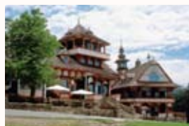
Libušin a Maměnka