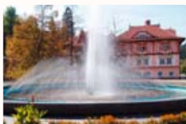
Fontána na Lázeňském náměstí XX