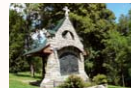
Kaplička Křížové cesty