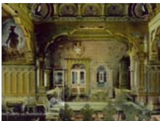
Libušín - dobová pohlednice, 1911