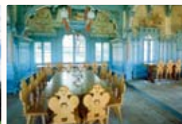
Libušin - interiér jídelny